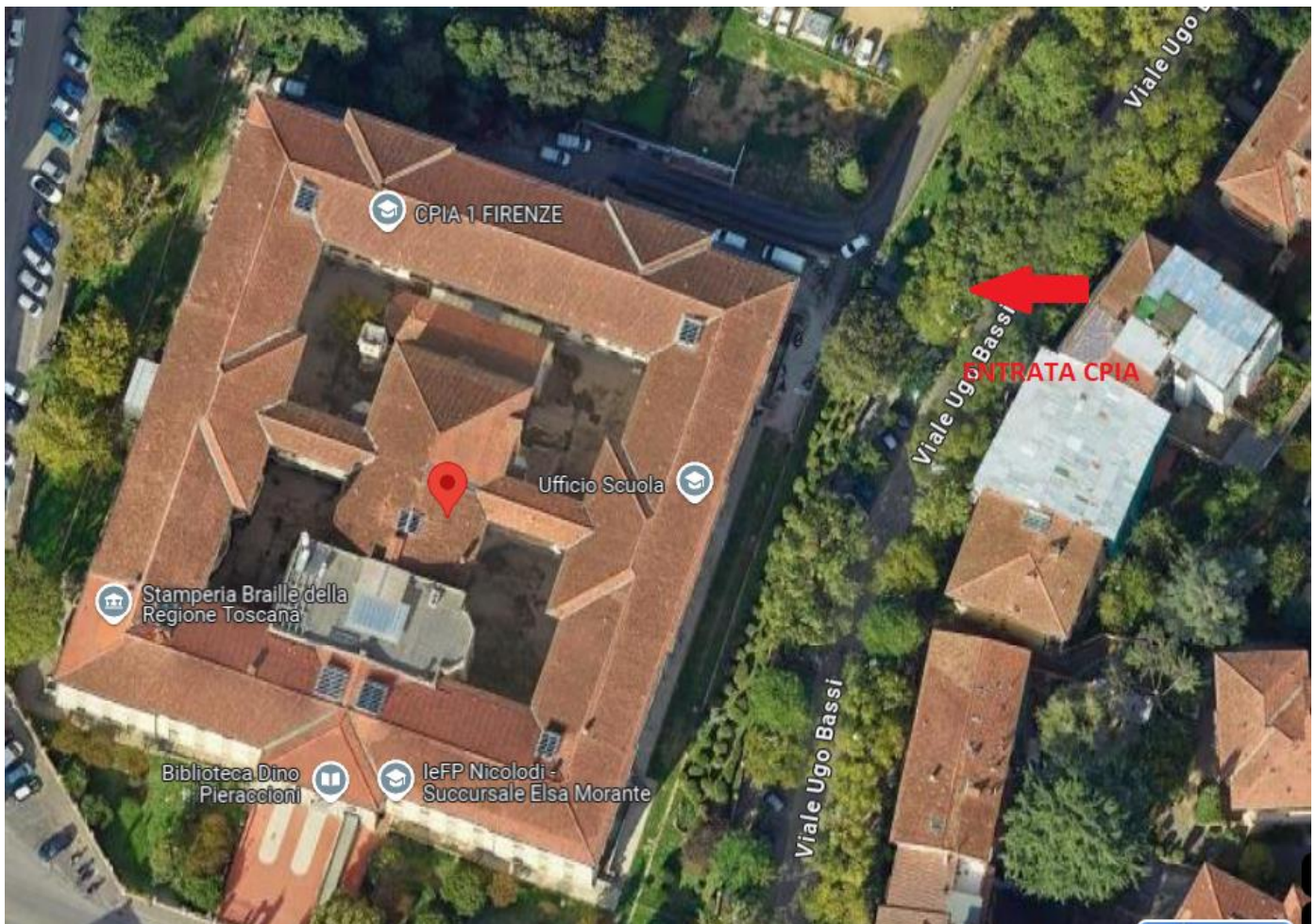
Fig. 1: Posizione del cancello di ingresso su viale Bassi

A causa dei lavori di restauro delle coperture fino a nuova comunicazione l'accesso e l'uscita dai locali del plesso di Nicolodi avverranno dal cancello pedonale di viale Bassi all'altezza della Scuola Fasolo.