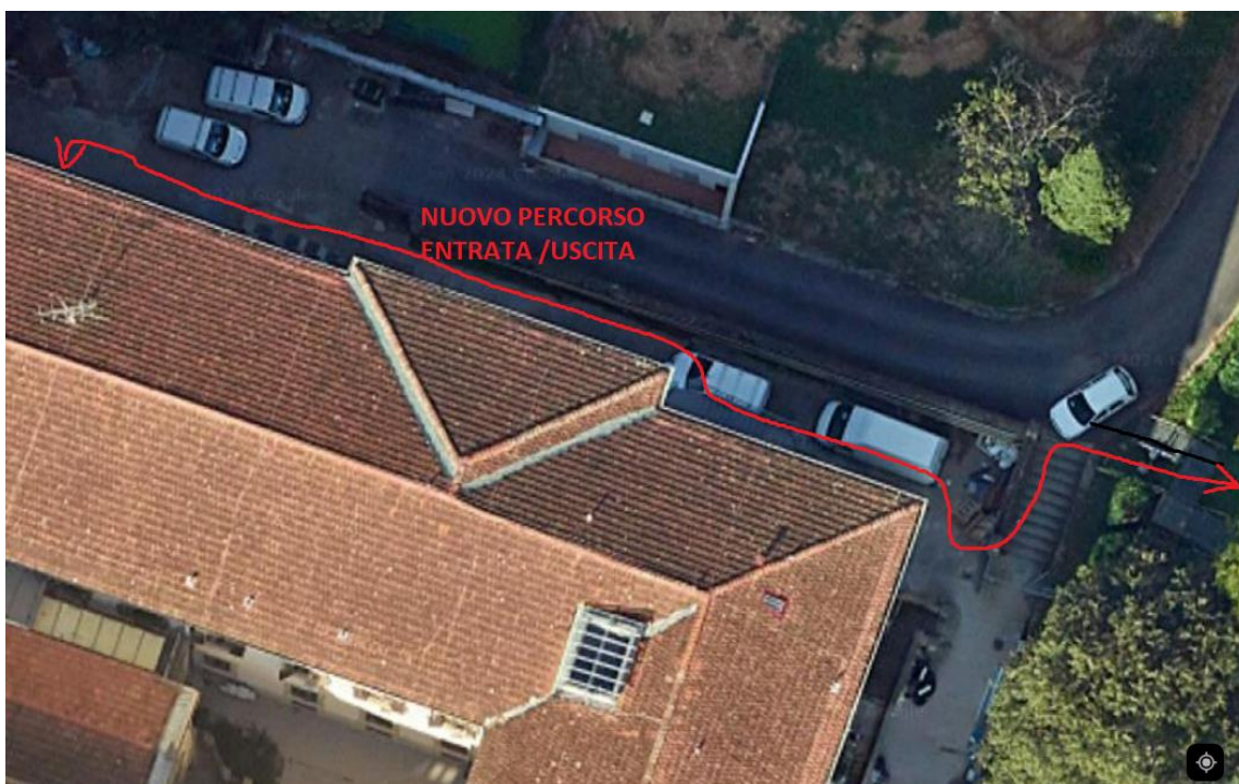
Fig. 3: Nuovo percorso di ingresso/uscita

Si prega di attenersi al percorso pedonale illustrato. Qualsiasi deviazione dal percorso qui indicato, evidenziato in loco dalla cartellonistica, implica l'ingresso in zona interessata da cantiere ed è svolto a proprio rischio e pericolo.